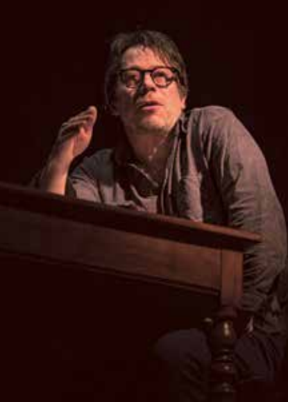
Mathieu Amalric