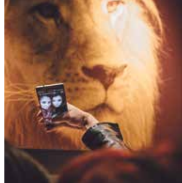
Selfie, Fureur de lire

Dans notre espace du rez-de-chaussée, plusieurs expositions se sont enchaînées, comme autant d'échos à des livres édités. L'Ange blanc , première exposition individuelle à Genève du jeune et ambitieux photographe suisse Niels Ackermann, a regroupé une sélection de photographies issues de l'ouvrage éponyme publié par les éditions Noir sur Blanc. Cette série, réalisée dans la petite cité ukrainienne de Slavoutytch, s'interroge sur l'après-Tchernobyl en se focalisant sur les jeunes gens de cette ville. Niels Ackermann a recueilli leurs témoignages, qu'il a mis en regard avec ses images. Sur nos murs, c'est précisément ce dialogue de l'écrit et de l'image que nous avons privilégié. Vernie en hiver 2016, l'exposition a couru jusqu'à fin avril 2017.